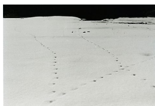
Véga de Comeya Asturias 2/2016