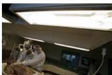
Photo 3 – Les infirmiers et l'assistant chirurgien préparent un patient avant une opération des paupières.