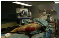
Photo 2 – L'anesthésiste veille sur son patient.