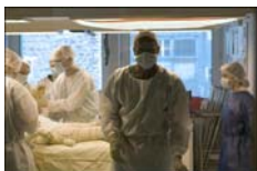
Photo 6 – La fin d'une intervention, les bandages sont presque finis, la fatigue se fait sentir parmi les membres du staff.