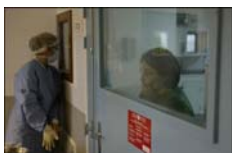
Photo 1 – Une interne découvre le service des grands brûlés.