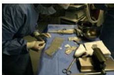
Photo 5 – Chirurgie réparatrice. Préparation d'un greffon avant pose sur le patient.