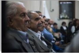
Photo 05 - Les membres de la communauté d'Iqrit sont tous Chrétiens, Grecs Catholiques. Ils parlent souvent de leur retour à Iqrit dans leurs prières. Iqrit, Galilée, Israël. 1 er novembre 2014.