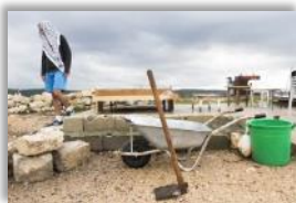
Photo 10 - Depuis l'été 2012, des jeunes de la troisième génération ont décidé de venir habiter à tour de rôle à Iqrit, malgré l'interdiction d'Israël. Ils essaient toujours d'améliorer leurs conditions de vie: ils arrangent l'abri, ils plantent des arbres, ou réparent le poêle. Iqrit, Galilée, Israël. 1 er novembre 2014.