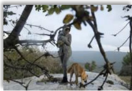
Photo 14 - Walaa n'est pas originaire d'Iqrit. Elle est musulmane et a rencontré des jeunes d'Iqrit à Haïfa. Depuis, elle vient parfois ici le week end, pour soutenir leur cause et les aider dans leur combat. Iqrit, Galilée, Israël. 1 er novembre 2014.