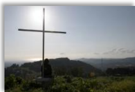
Photo 20 - Ce qui reste du village d'Iqrit est situé au milieu de champs. Il y a des Kibbutz aux alentours où les habitants viennent faire paître leur bétail. Mais la communauté d'Iqrit détient les actes de propriété. Iqrit, Israël. 14 mars 2015.