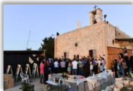
Photo 09 - Chaque mariage célébré dans l'église d'Iqrit est l'occasion de faire la fête et aussi de resserrer les liens de la communauté. Iqrit, Galilée, Israël. 25 octobre 2014.