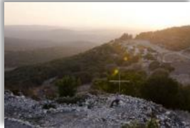
Photo 06 - Les parents de Georges vivaient à Iqrit avant d'en être expulsés en 1948. Il se tient à l'emplacement de leur maison, avant qu'elle soit détruite par l'armée Israélienne. Iqrit, Galilée, Israël. 25 octobre 2014.