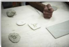
Photo 18 - L'association de la communauté d'Iqrit a obtenu des fonds pour un atelier de poterie pour apprendre aux jeunes à fabriquer des objets qu'ils pourront ensuite vendre lors des camps d'été. Ici, Haytham, le neveu de Georges, fabrique une tasse. Kfar Yasif, Israël. 13 Mars 2015.