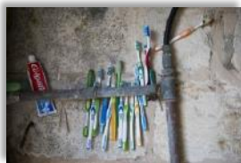
Photo 15 - Pendant les week ends, il y a beaucoup de monde à Iqrit: tous les jeunes profitent du week end pour dormir dans le village. Iqrit, Israël. 14 Mars 2015.