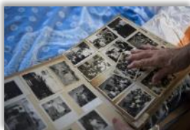
Photo 04 - Quand les soldats Israéliens sont arrivés à Iqrit, ils ont proposé 2 solutions aux habitants: soit partir au Liban pour toujours, soit aller à Rami, un village voisin, et uniquement pour 2 semaines leur promirent-ils. Mais après leur départ, il n'était plus possible pour eux de circuler librement et donc de revenir à Iqrit. Haïfa, Galilée, Israël. 29 octobre 2014.

Photo 03 - Des membres de la communauté d'Iqrit sont venus à la messe célébrée par le Pape François à Bethléem. Ils espèrent que le souverain Pontife intercèdera en leur faveur suite au déjeuner qu'il aura avec Shadia et sa famille. Bethléem, Territoires Palestiniens Occupés. 25 mai 2014.