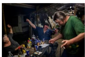
Photo 19- La consommation d'alcool est interdite en semaine dans la communauté. Une exception : le vendredi soir. Août 2013.