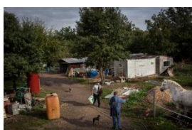
Photo 01- Vue d'ensemble des parties communes du village de l'Association du 115 du particulier. Villebéon, le 4 Octobre 2013.

Villebéon, Seine-et-Marne France, 2013 / 2014