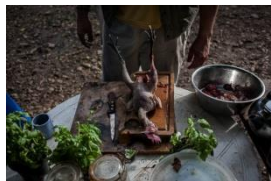
Photo 06- Un coq s'est échappé du poulailler. Jacquouille, un des chiens du village ne lui a laissé aucune chance. Octobre 2014.