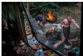
Photo 05- Après réception de la nourriture, une équipe de la communauté trie les denrées, destinées à être consommées rapidement, congelées, transformées en bocaux pour l'hiver ou données à des riverains dans le besoin. Août 2013.