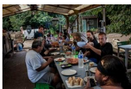
Photo 07- Repas communautaire dans l'un des bâtiments "en dur" du village. Août 2014.