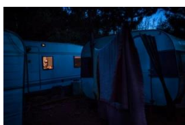
Photo 09- Serge dans sa caravane. L'organisation du village implique une forme de promiscuité entre les habitants. Janvier 2014.