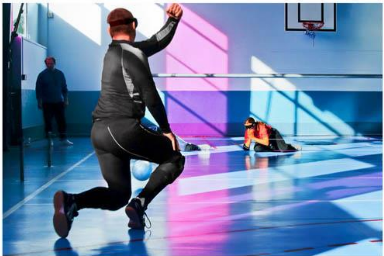
Photo 12 - Pratiqué dans un gymnase, avec un ballon sonore, yeux bandés, le torball est un sport d'équipe qui requiert le goût de l'effort et une condition physique maximale pour participer à des compétitions.