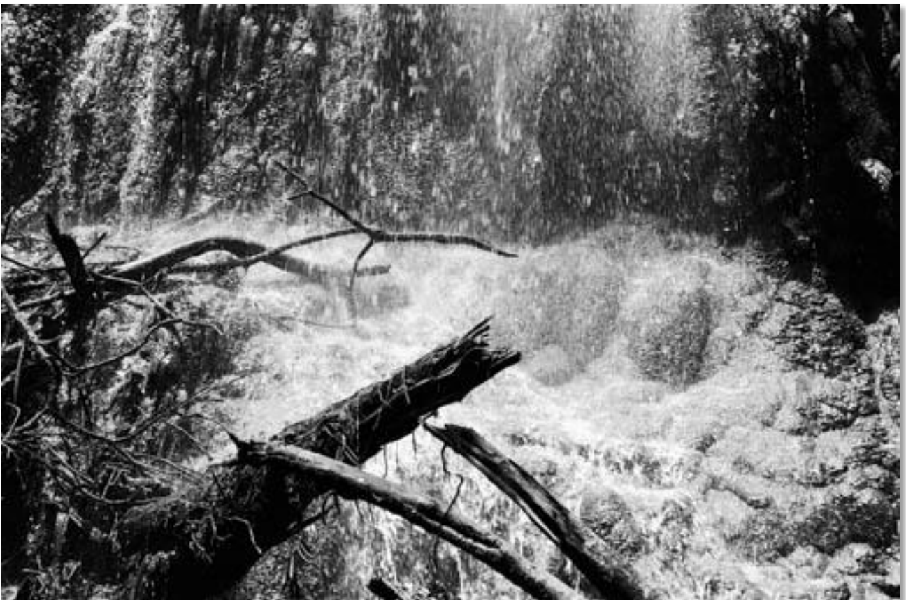
Photo 05 - Cascade d'eau pendant la saison des pluies. Forêt Lacandone. Etat du Chiapas, Mexique. 07/1996.