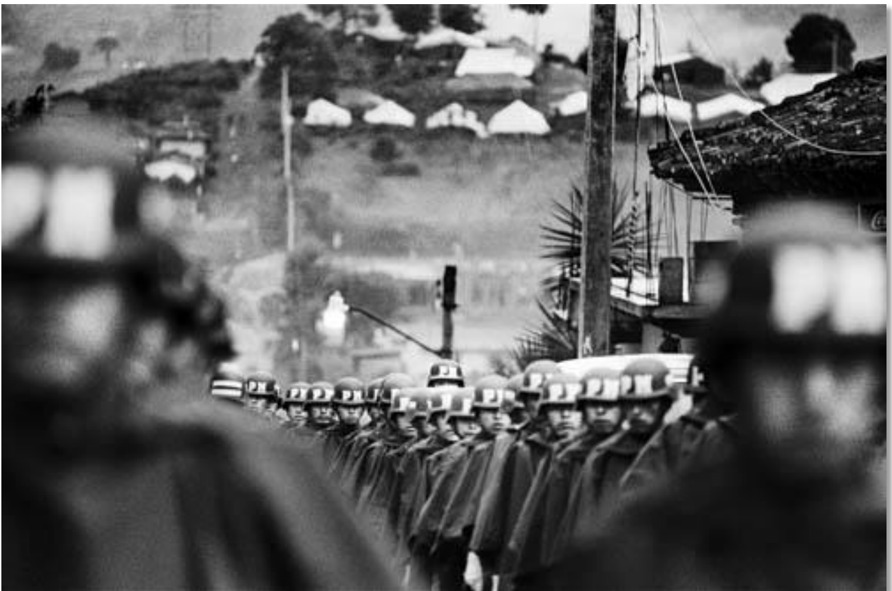
Photo 01 - Défilé de l'armée mexicaine. Au cours du dialogue entre Zapatistes et représentants du gouvernement. San Andres Larrainzar, Chiapas, Mexique. 07/1995.