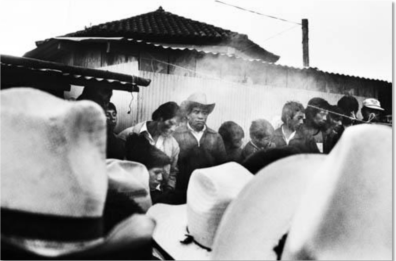
Photo 02 - Au cours du dialogue entre Zapatistes et représentants du gouvernement. San Andres Larrainzar, Chiapas, Mexique. 07/1995.