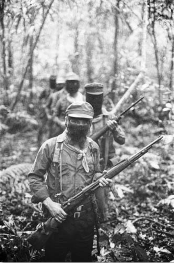
Photo 04 - Troupes de l'EZLN (Armée zapatiste de libération nationale) Forêt Lacandone. Chiapas, Mexique. 07/1995.