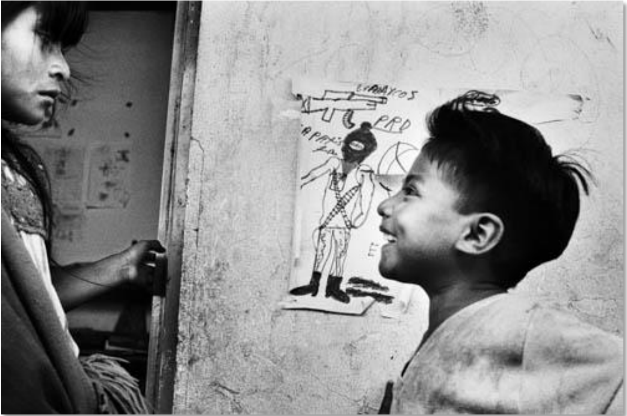
Photo 12 - Un enfant a fait un dessin du Sous-commandant Marcos armé. Dans l'école improvisée du camp de déplacés de Pólho. Peu après le massacre d'Actéal, et suite à la formation de groupes paramilitaires dans la région de Los Altos, des milliers de déplacés se réfugient dans le village de Pólho (10 000 personnes selon les sources zapatistes). Pólho fait partie de la commune autonome zapatiste d'Oventic, située dans la commune de Chenalhó. Région de Los Altos. Etat du Chiapas. Mexique. 01/1998 au 02/1998.