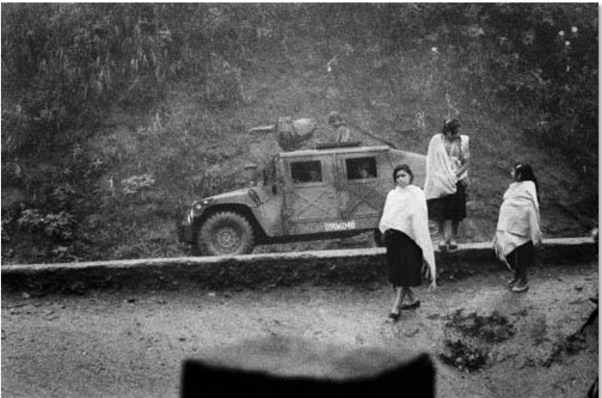
Photo 13 - Des militaires de l'armée mexicaine passent devant l'entrée du camp de déplacés de Polhó. La situation reste très tendue dans la région de Los Altos, deux ans après le massacre d'Acteal où 45 indiens ont trouvé la mort. Les paramilitaires, proches du parti au pouvoir, sèment toujours la terreur et divisent les villages. A Polhó, la vie s'organise petit à petit. Commune autonome zapatiste d'Oventic, située dans la commune de Chenalhó. Région de Los Altos. Etat du Chiapas. Mexique. 12/1999.