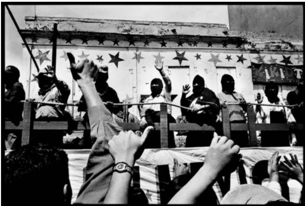
Photo 18 - Marche Zapatiste. Arrivée des commandants Zapatistes sur le Zocalo de Mexico, DF. Mexique 03/2001.