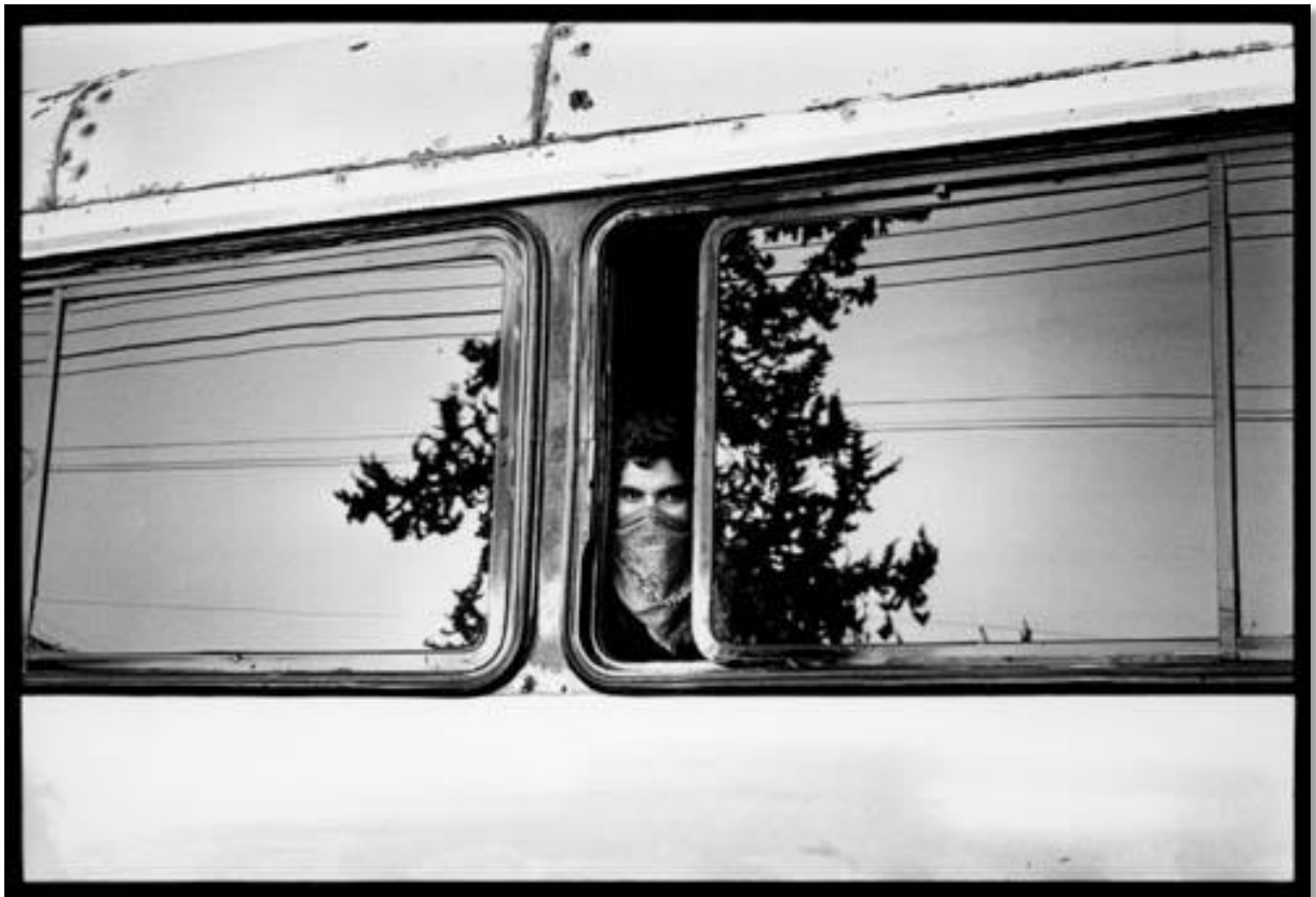
Photo 15 - Marche Zapatiste. Un Zapatiste dans la caravane au départ de Puebla. Etat de Puebla. 02/2001.