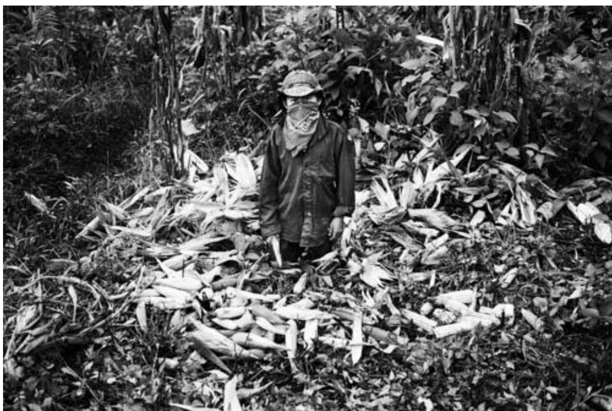
Photo 21 - Au cours de la cueillette du maïs, dans le village zapatiste de Monterrey. Municipalité autonome de La Garrucha. Le 1 er janvier 2014 marquera l'anniversaire des 20 ans de l'insurrection zapatiste. A cette occasion, l'EZLN (Armée Zapatiste de Libération Nationale) a organisé La Escuelita (la petite école), structure qui a permis à 4500 personnes d'être accueillies une semaine durant dans les villages rebelles, de vivre le quotidien des communautés et d'apprendre l'autonomie selon les zapatistes. Chiapas. Mexique. 12/2013.