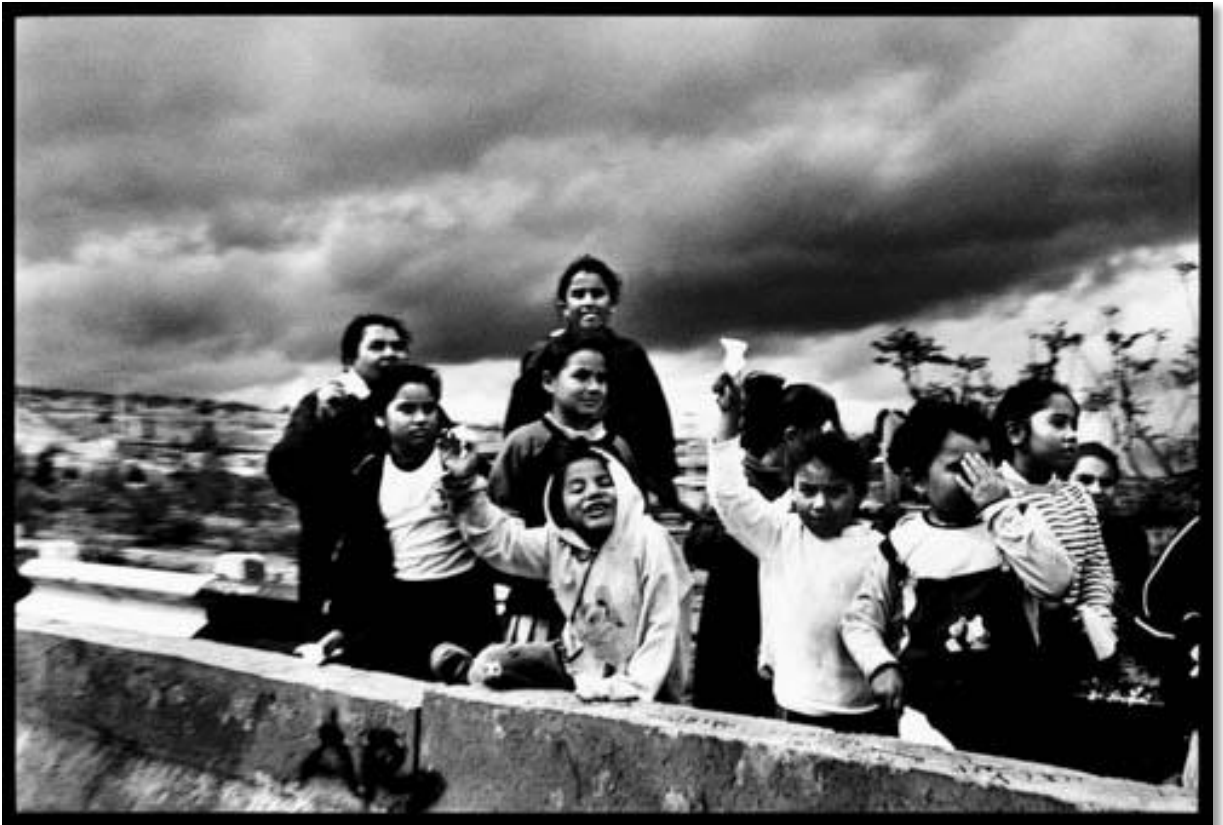
Photo 17 - Marche Zapatiste. Sur la route vers Nurio. Etat de Michoacan. Mexique. 03/2001.