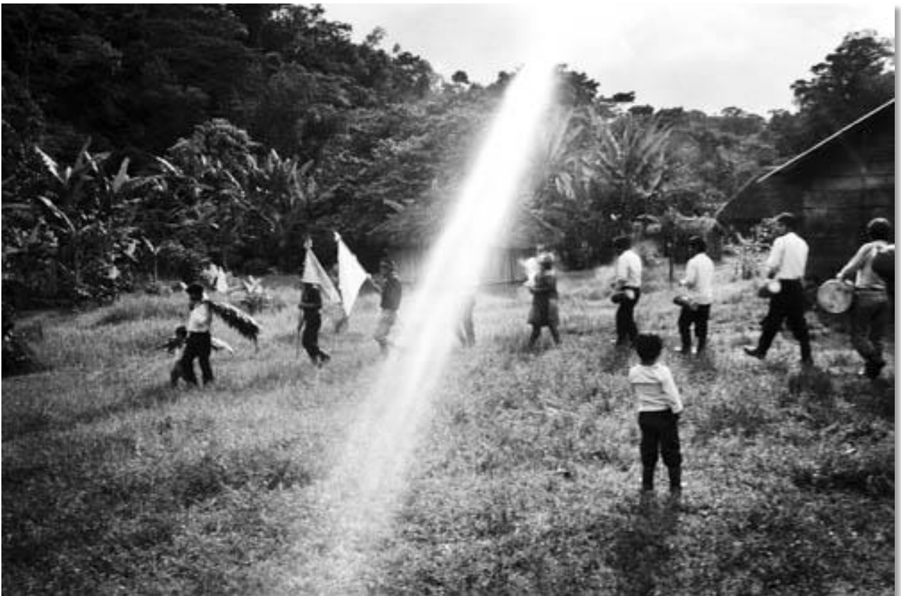
Photo 07 - Au cours des fêtes de la Guadalupe. Village de Guadalupe Trinidad. Forêt Lacandone. Etat du Chiapas, Mexique. 07/1996.