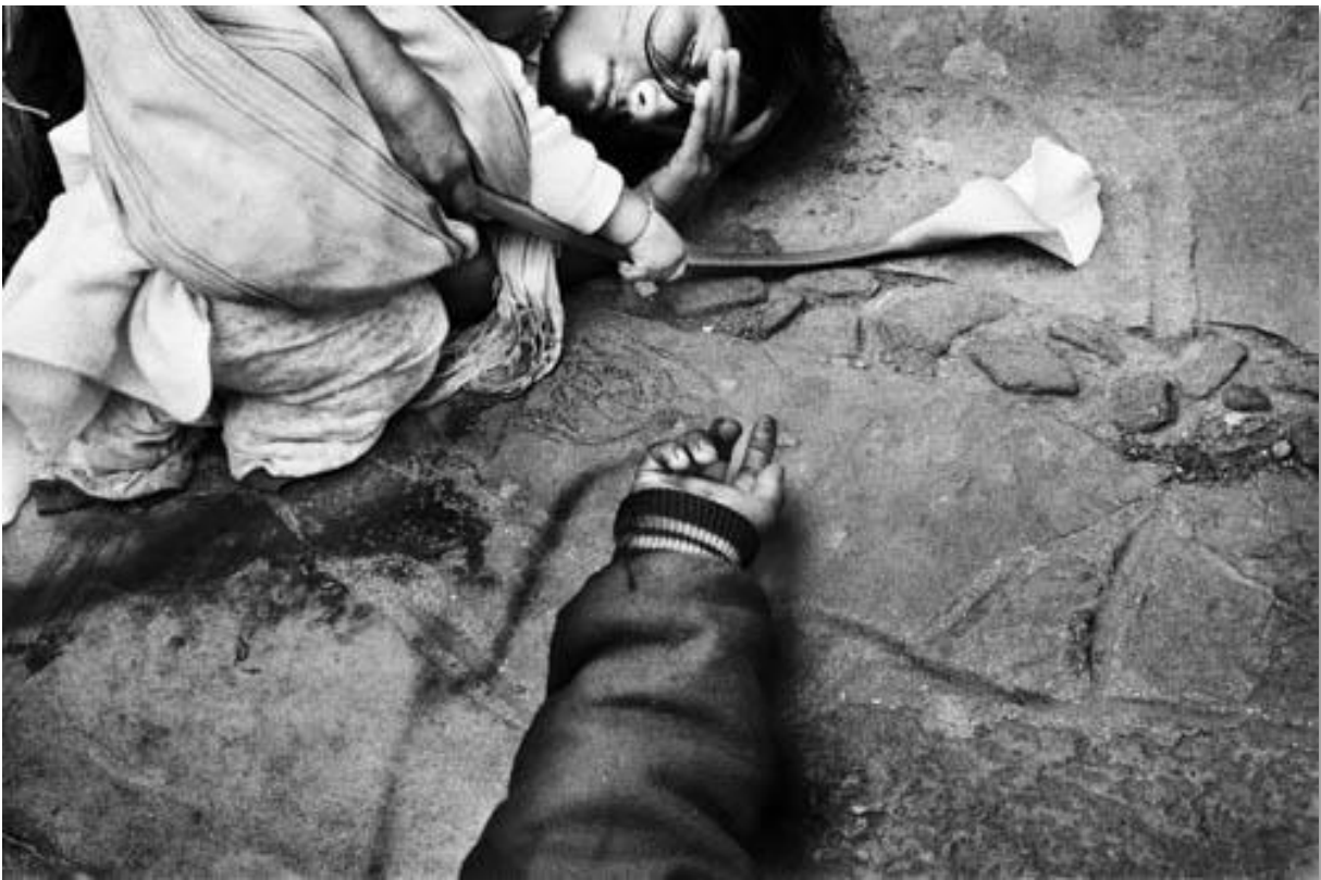
Photo 11 - Action à San Cristobal pour protester contre le massacre d'Actéal. Le 22 décembre 1997, un groupe de paramilitaires proche du PRI, parti au pouvoir, massacre 45 indiens dans le village d'Actéal. Les victimes appartiennent à un groupe non violent de la société civile Las Abejas, réunis pour prier dans l'église du village. Las Abejas sont proches des zapatistes bien qu'ils aient toujours marqué leur indépendance politique. L'armée mexicaine était présente à moins de 200 mètres du lieu même, elle n'interviendra pas durant les heures que durera le massacre. Elle a été accusée d'avoir facilité le déplacement des paramilitaires et d'avoir fourni les armes. San Cristobal de las Casas. Etat du Chiapas. Mexique. 01/1998.