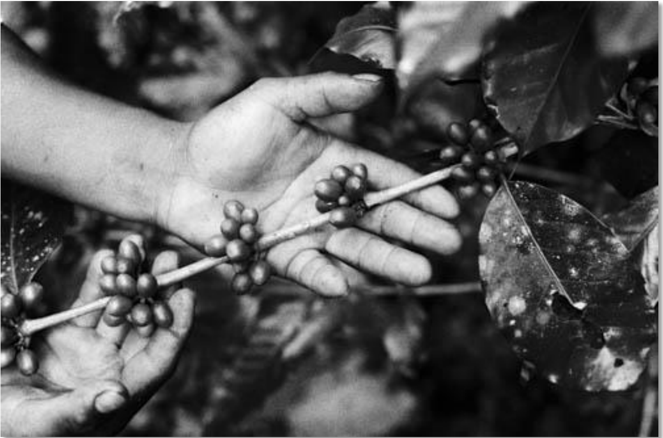
Photo 06 - Culture de café. Dans cette région de la vallée de San Quintin, le café est la principale ressource des paysans indiens. Village de Guadalupe Trinidad. Forêt Lacandone. Etat du Chiapas, Mexique. 07/1996.