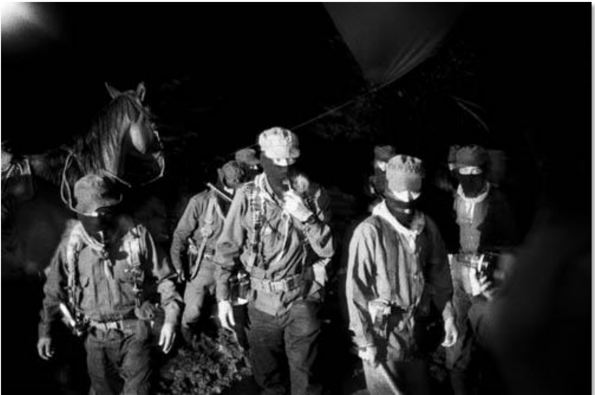
Photo 09 - Le major Moises, et le sous-commandant Marcos, leaders de l'insurrection zapatiste. La Rencontre Intercontinentale pour l'humanité et contre le néolibéralisme. A l'invitation de l'EZLN (Armée Zapatiste de Libération Nationale), des milliers de sympathisants du monde entier se sont rendus dans la région du Chiapas, à l'occasion de rencontres et débats politiques, au cours d'une semaine. 3000 personnes ont été réparties dans cinq villages autonomes. La Realidad. Chiapas, Mexique. 07/1996 au 08/1996.