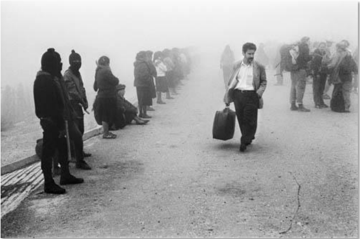
Photo 08 - La Rencontre Intercontinentale pour l'humanité et contre le néolibéralisme. A l'invitation de l'EZLN (Armée Zapatiste de Libération Nationale), des milliers de sympathisants du monde entier se sont rendus dans la région du Chiapas, à l'occasion de rencontres et débats politiques, au cours d'une semaine. 3000 personnes ont été réparties dans cinq villages autonomes. Un homme entre dans le village après la fouille obligatoire. Oventic. Chiapas, Mexique. 07/1996 au 08/1996.