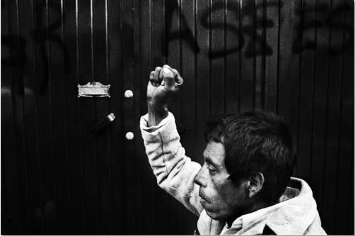
Photo 10 - Action à San Cristobal pour protester contre le massacre d'Actéal. Le 22 décembre 1997, un groupe de paramilitaires proche du PRI, parti au pouvoir, massacre 45 indiens dans le village d'Actéal. Les victimes appartiennent à un groupe non violent de la société civile Las Abejas, réunis pour prier dans l'église du village. Las Abejas sont proches des zapatistes bien qu'ils aient toujours marqué leur indépendance politique. L'armée mexicaine était présente à moins de 200 mètres du lieu même, elle n'interviendra pas durant les heures que durera le massacre. Elle a été accusée d'avoir facilité le déplacement des paramilitaires et d'avoir fourni les armes. San Cristobal de las Casas. Etat du Chiapas. Mexique. 01/1998.