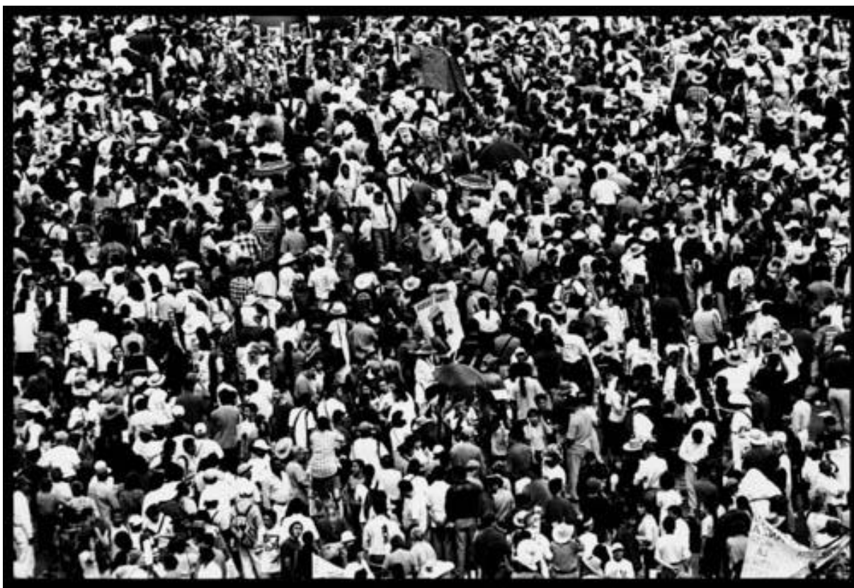
Photo 19 - Marche Zapatiste. La foule sur le Zocalo de Mexico DF. Mexique 03/2001.