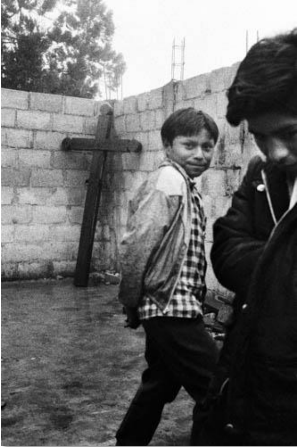
Photo 14 - Camps de déplacés de Polhó. La religion (catholique et protestante) est très présente dans les communautés indiennes. La situation reste très tendue dans la région de Los Altos, deux ans après le massacre d'Acteal où 45 indiens ont trouvé la mort. Les paramilitaires, proches du parti au pouvoir, sèment toujours la terreur et divisent les villages. A Polhó, la vie s'organise petit à petit. Commune autonome zapatiste d'Oventic, située dans la commune de Chenalhó. Région de Los Altos. Etat du Chiapas. Mexique. 12/1999.