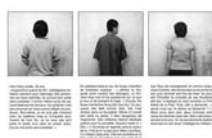
Photo 06 - Portraits de dos / peur - surveillance - silence - 2005