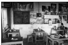
Photo 04 - Teashop - Moulmein - 2006