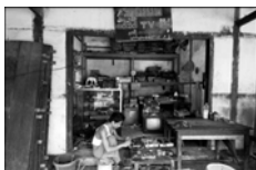
Photo 05 - Magasin d'électronique et de télévisions - Sittwe 2005