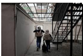
Photo 14 - La sortie de l'International School of Kabul. 2012