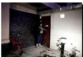
Photo 13 - Un des gardes armés à l'entrée du Blue Flame. 2012