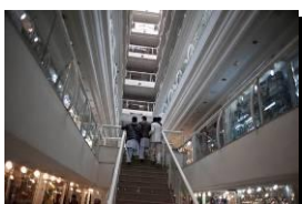
Photo 11 - Un groupe de jeunes chahute dans les escalators du Kaboul City Center, premier centre commercial à avoir ouvert à Kaboul en 2005. Le centre possède un ascenseur et des escalators, une première à l'époque. 2012