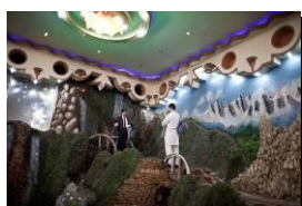
Photo 12 - Un père se fait photographier avec ses enfants devant le décor d'un wedding hall. Les wedding halls sont de gigantesques salles de réception où on célèbre les mariages dans les villes, dans lesquels on compte généralement un millier d'invités. 2012