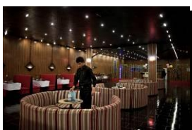
Photo 10 - Le restaurant du Strikers, le bowling de Kaboul. 2012