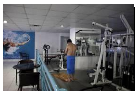
Photo 19 - L'heure de la prière pour un client du Blue Flame. 2012