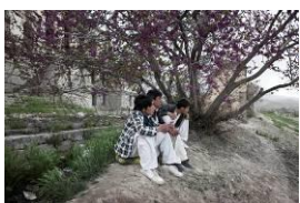
Photo 20 - Sur le flanc des ruines du Palais de Darulaman. 2012